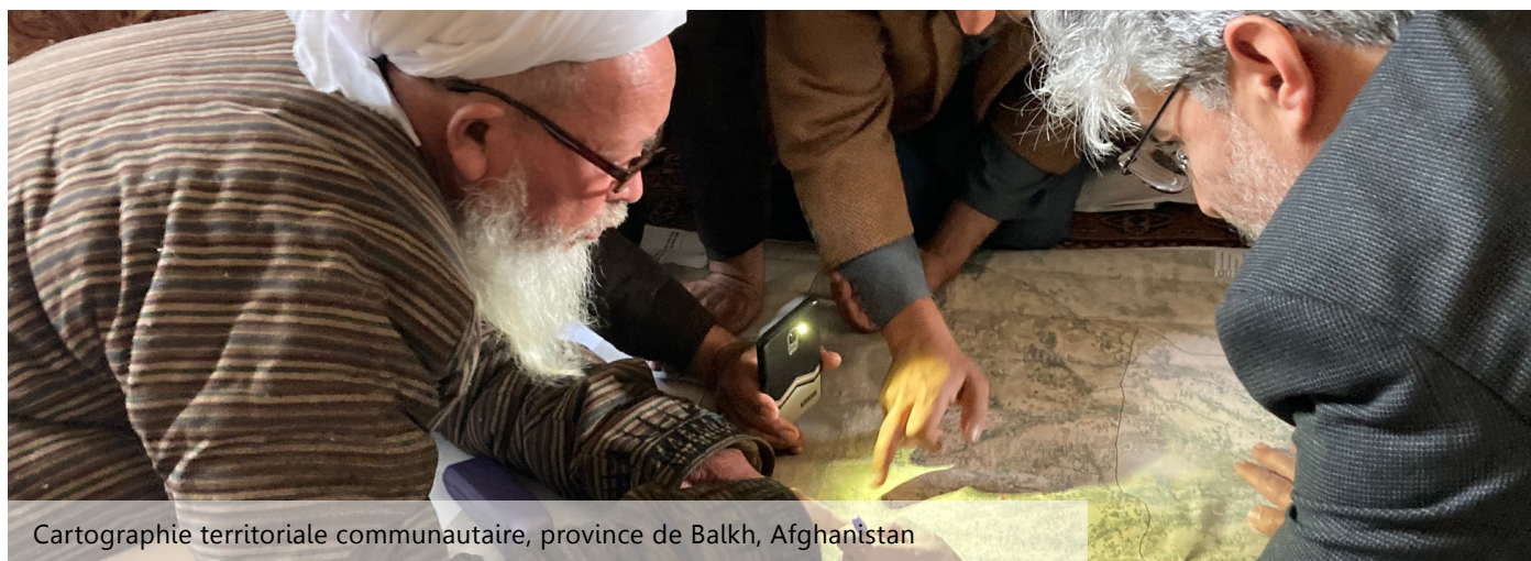
Cartographie territoriale communautaire, province de Balkh, Afghanistan

Grâce à AGORA, les défis locaux liés au changement climatique sont identifiés et les ressources financières et techniques peuvent être mobilisées pour la mise en œuvre de solutions environnementalement soutenables, en complément des politiques et cadres réglementaires nationaux.