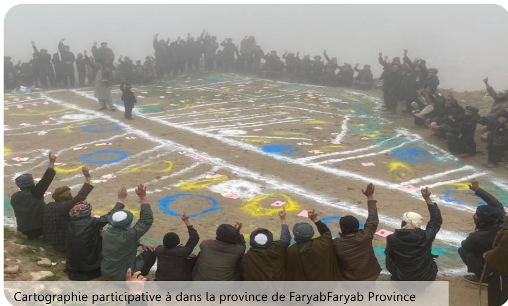
Cartographie participative à dans la province de Faryab Faryab Province

Depuis 2018, ACTED et IMPACT ont mis en œuvre, avec le soutien du Ministère des Affaires Etrangères norvégien, un projet AGORA conséquent couvrant quatre provinces dans le Nord de l'Afghanistan . Ce projet s'articule autour de 64 zones de voisinage traditionnelles appelées «manteqas» . ACTED a mis en œuvre des projets prioritaires communautaires identifiés dans chaque manteqa pour un montant de 3 millions de dollars US au cours des dernières années. En s'appuyant sur les mécanismes de gouvernance communautaire informelle qui sous-tendent la plupart des moyens de subsistance ruraux en Afghanistan, l'appropriation par les communautés et la soutenabilité des projets ont été facilitées.