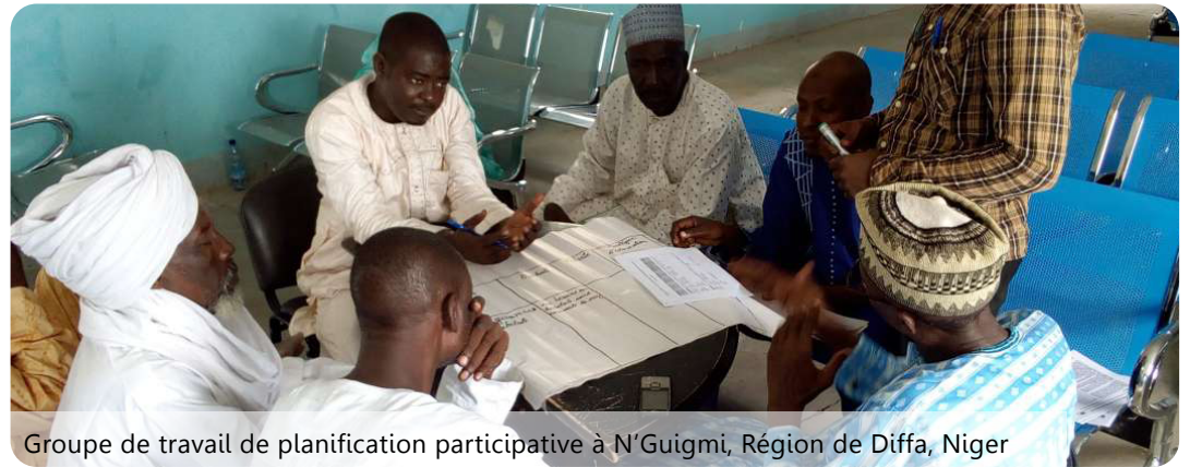
Groupe de travail de planification participative à N'Guigmi, Région de Diffa, Niger

Depuis 2018, au Niger et en République centrafricaine, deux consortiums d'ONGs financés par l'Union Européenne ont aidé 24 communautés locales à identifier et mettre en œuvre des interventions de relèvement prioritaire, et ont renforcé les capacités des autorités locales. AGORA a soutenu les acteurs locaux de chaque municipalité pour élaborer et mettre en œuvre leur plan de relèvement local.