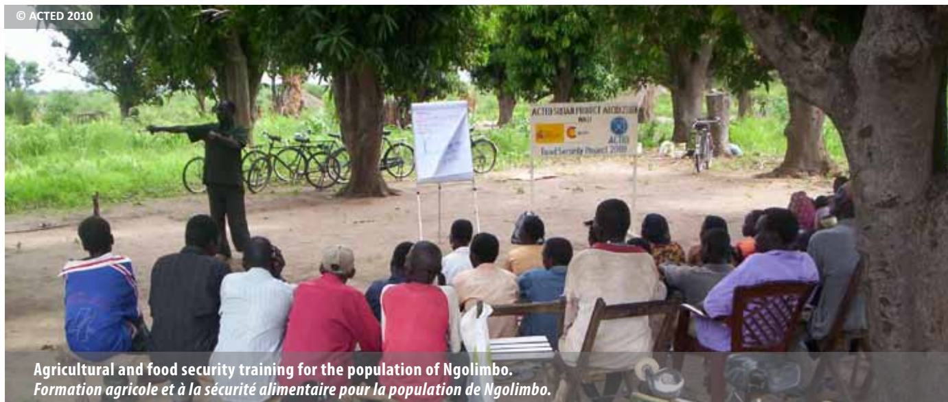
Agricultural and food security training for the population of Ngolimbo. Formation agricole et à la sécurité alimentaire pour la population de Ngolimbo.