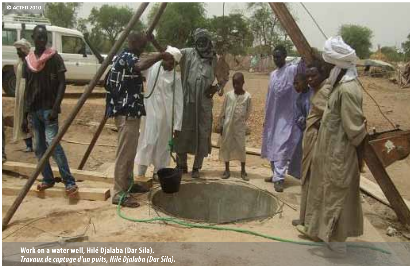
Work on a water well, Hilé Djalaba (Dar Sila). Travaux de captage d'un puits, Hilé Djalaba (Dar Sila).

ACTED a poursuivi en 2010 la mise en œuvre de programmes destinés à faciliter l'accès à l'eau potable (construction de puits), les déplacements (aménagement de pistes) et à améliorer la situation alimentaire (programme d'appui au maraîchage) et sanitaire (construction d'infrastructures et sensibilisation) de ces populations. L'enjeu de cette intervention est de fournir aux personnes qui ont fait le choix de rentrer chez elles ou de s'intégrer à un village les conditions nécessaires à une installation durable et à une existence autonome.