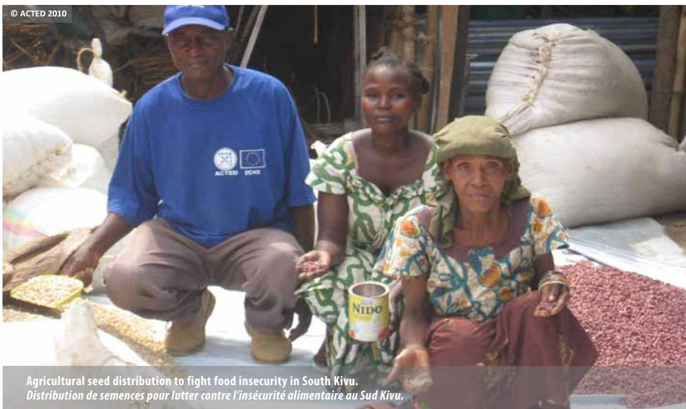
Agricultural seed distribution to fight food insecurity in South Kivu. Distribution de semences pour lutter contre l'insécurité alimentaire au Sud Kivu.