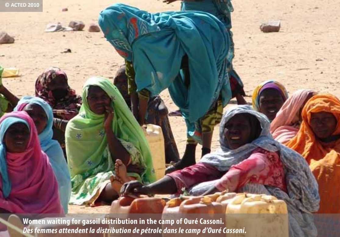
Women waiting for gasoil distribution in the camp of Ouré Cassoni. Des femmes attendent la distribution de pétrole dans le camp d'Ouré Cassoni.