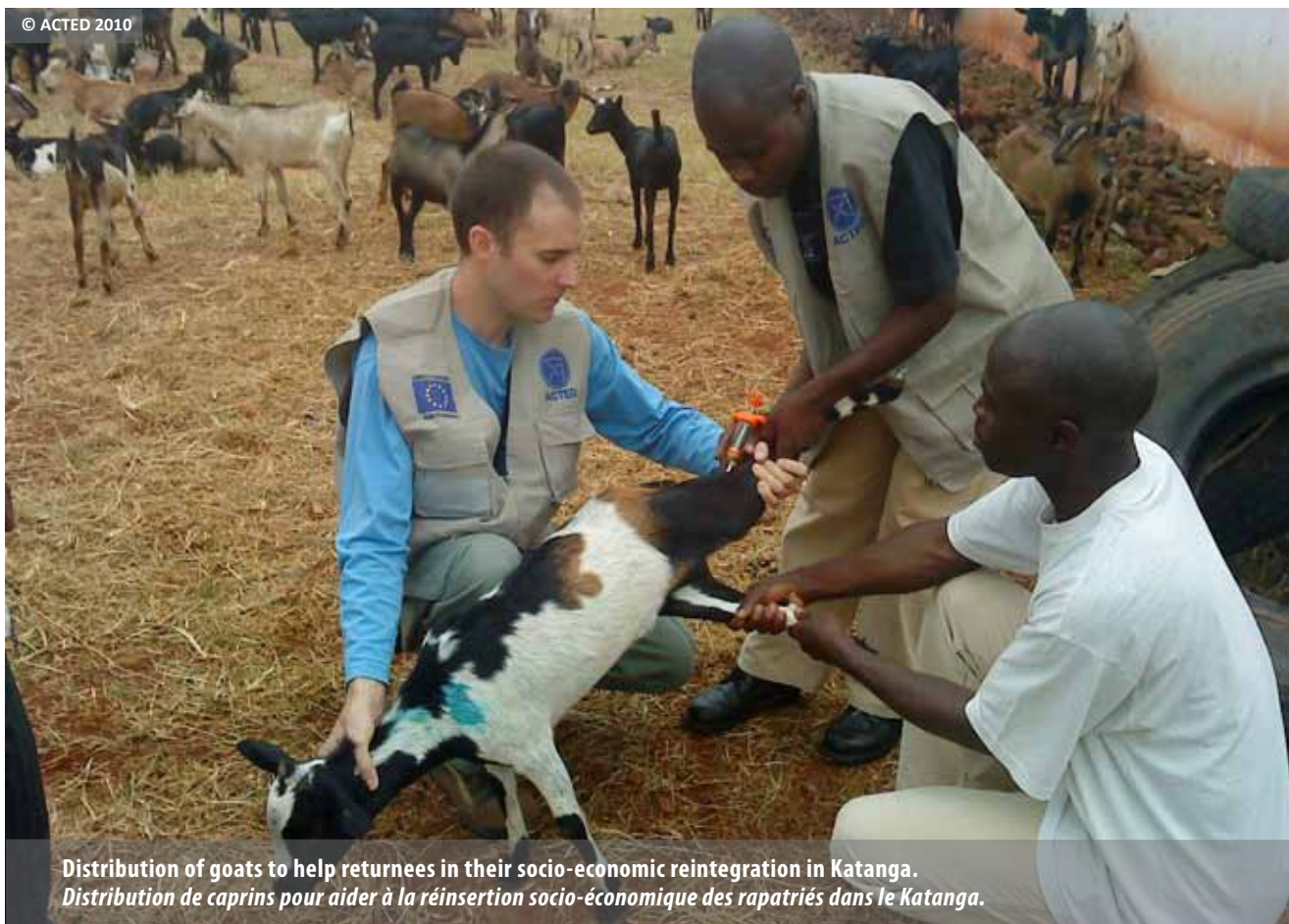
Distribution of goats to help returnees in their socio-economic reintegration in Katanga. Distribution de caprins pour aider à la réinsertion socio-économique des rapatriés dans le Katanga.