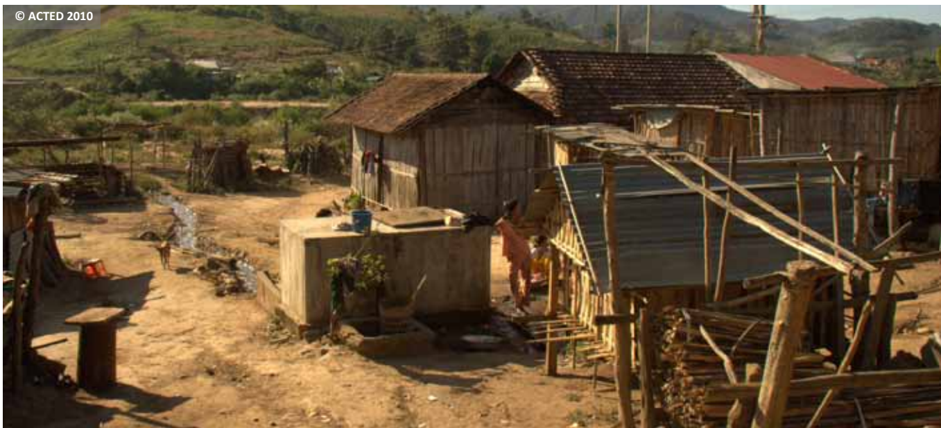
One of the villages affected by flash flooding in the Kon Tum province. Un des villages affectés par les inondations éclairs dans la province de Kon Tum.

Programme, ACTED, in partnership with CECI, began the implementation of a third phase of the Building Community Resistance to Disasters project with the aim of strengthening disaster risk reduction. In the first steps of the project, carried out in 2010, local trainers were selected from among the various government departments and mass mobilization organizations in the area, including the agriculture department, women's unions and youth associations, to facilitate various events at the village level in order to build the understanding and skill of villagers and officials to better prepare for and respond to disasters. Local trainers were provided with intensive training in areas such as conducting vulnerability and capacity assessments (VCAs), community-based disaster risk management (CBDRM), first aid, search and rescue, etc., and completed the VCA in 44 villages of Kon Tum and Nghe An provinces.