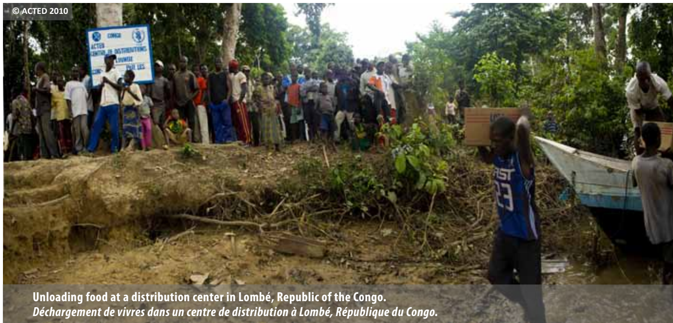
Unloading food at a distribution center in Lombé, Republic of the Congo. Déchargement de vivres dans un centre de distribution à Lombé, République du Congo.

The region followed up the partial takeover of Pharmaciens Sans Frontières's activities through synergies developed with its local counterparts (Vendée and Rhône-Alpes regions in France) in order to foster links in West Africa, in Burkina Faso and Benin, thus supporting interventions in the sectors of health and medicine supply.