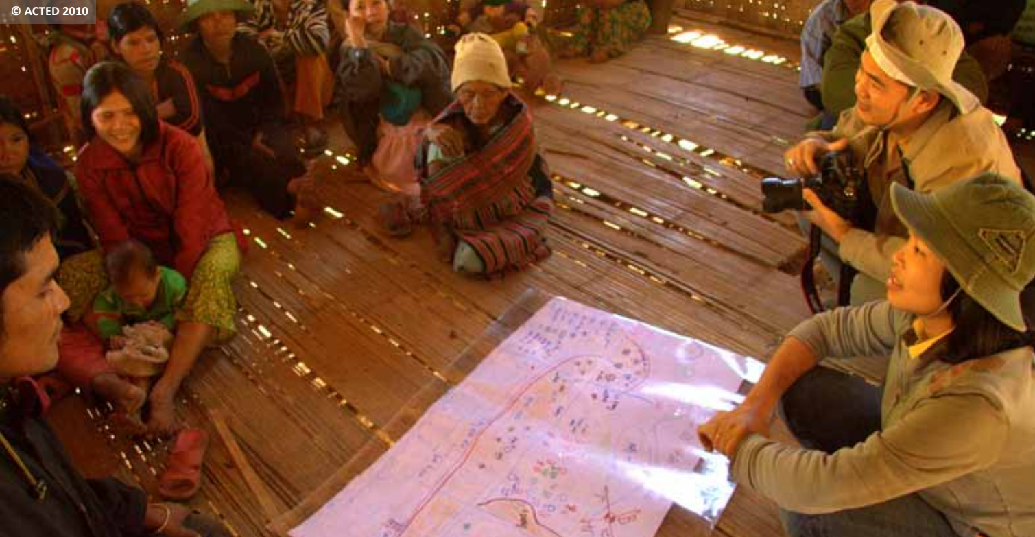
Inhabitants taking part in a village meeting with project staff on local disaster mapping, Kon Tum Province.

Des habitants échangent sur la cartographie des risques avec les responsables du projet au cours d'une réunion de village, Province de Kon Tum.