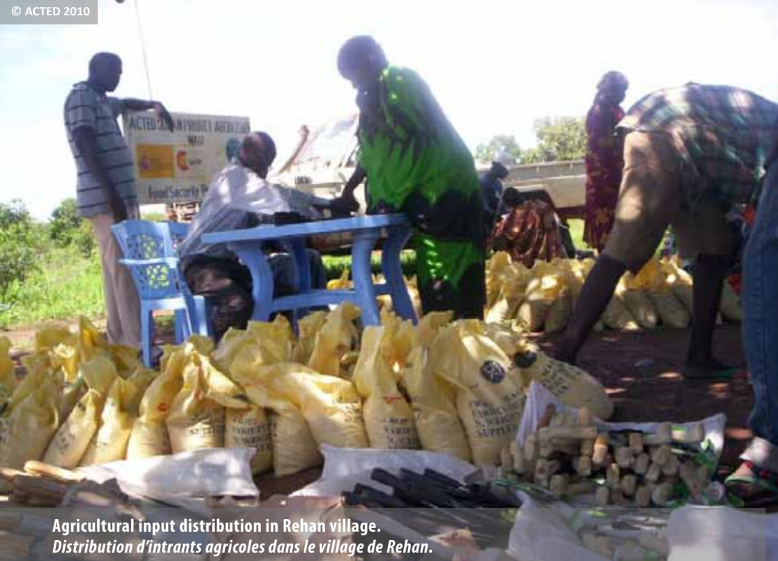
Agricultural input distribution in Rehan village. Distribution d'intrants agricoles dans le village de Rehan.