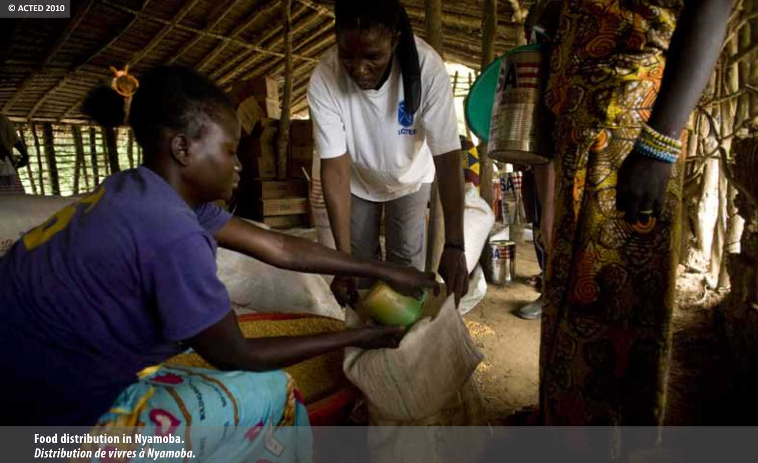
Food distribution in Nyamoba. Distribution de vivres à Nyamoba.