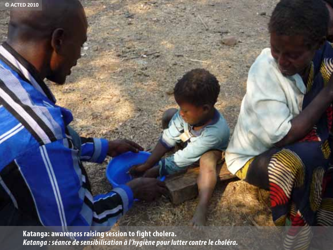
Katanga: awareness raising session to fight cholera. Katanga : séance de sensibilisation à l'hygiène pour lutter contre le choléra.