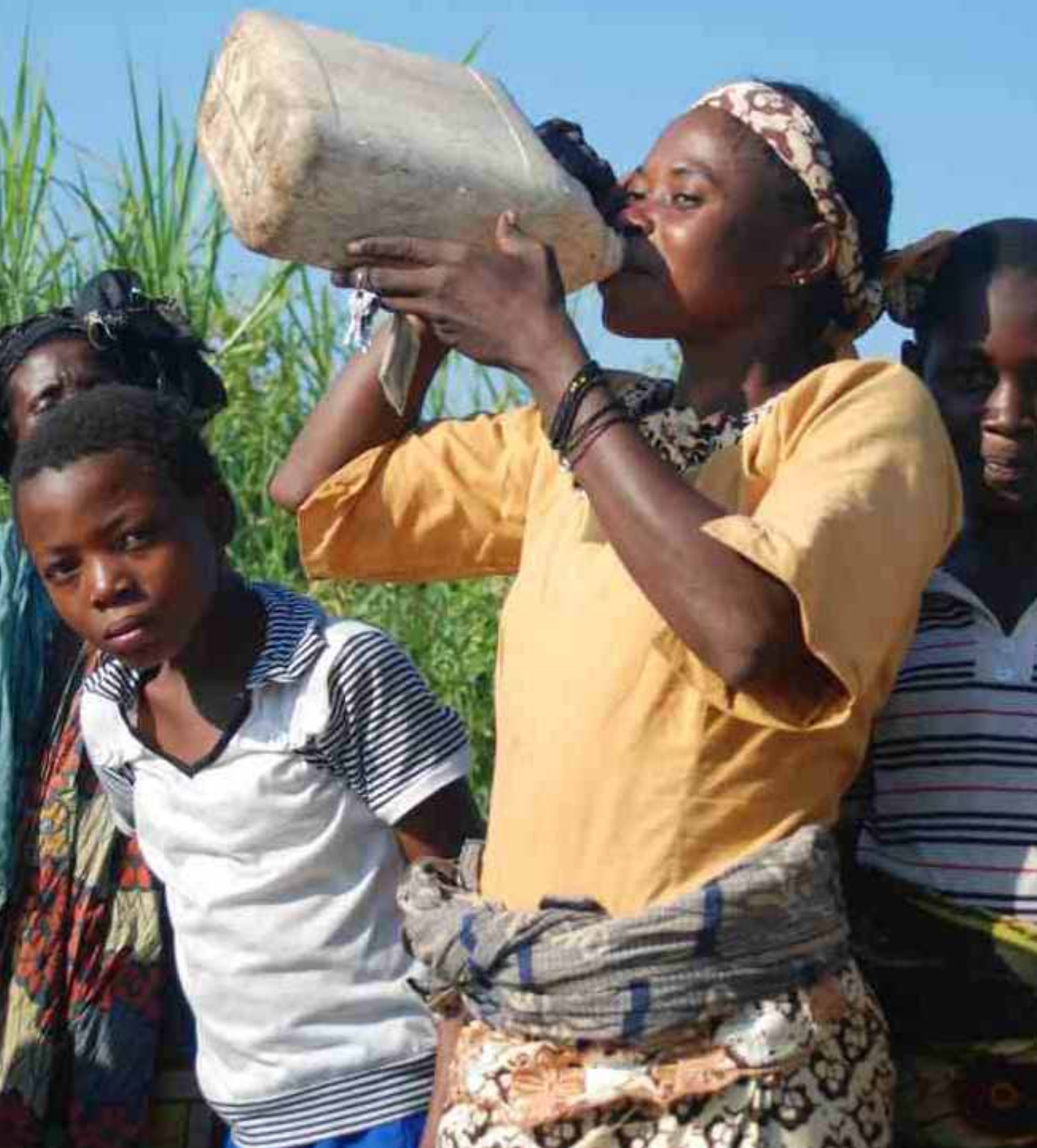
Access to potable water for the beneficiaries is one of ACTED's priorities, like here in DRC. L'accès à l'eau potable pour les bénéficiaires est l'une des priorités d'ACTED, comme ici en RDC.