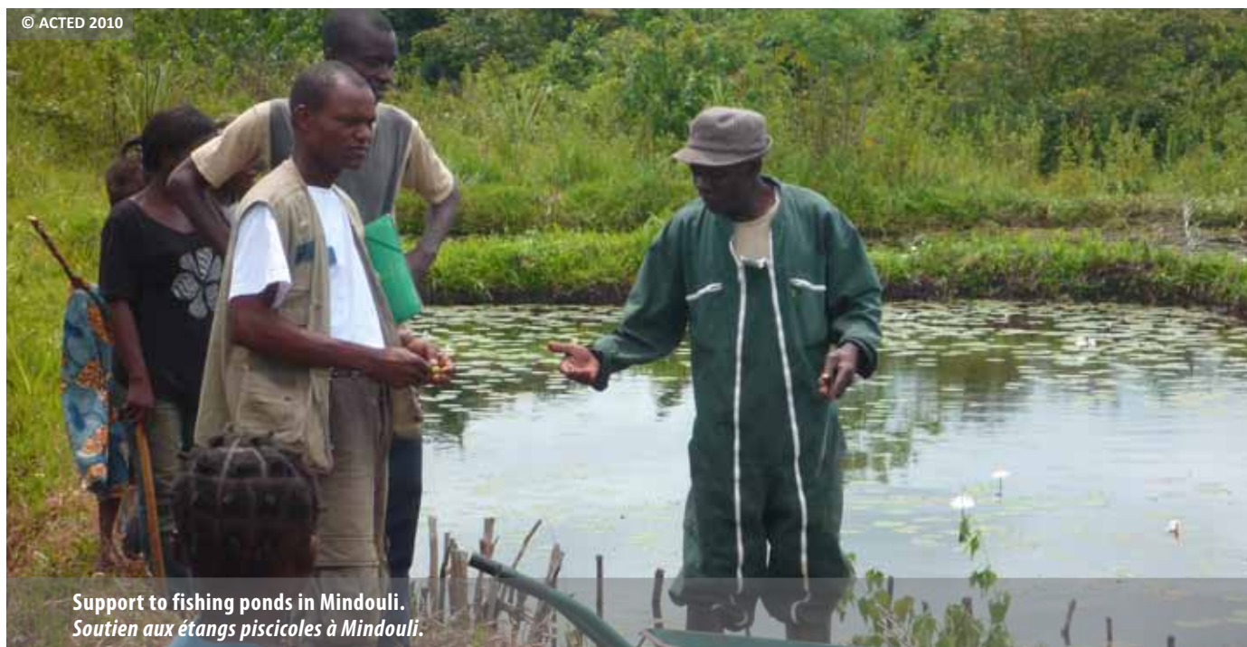
Support to fishing ponds in Mindouli. Soutien aux étangs piscicoles à Mindouli.