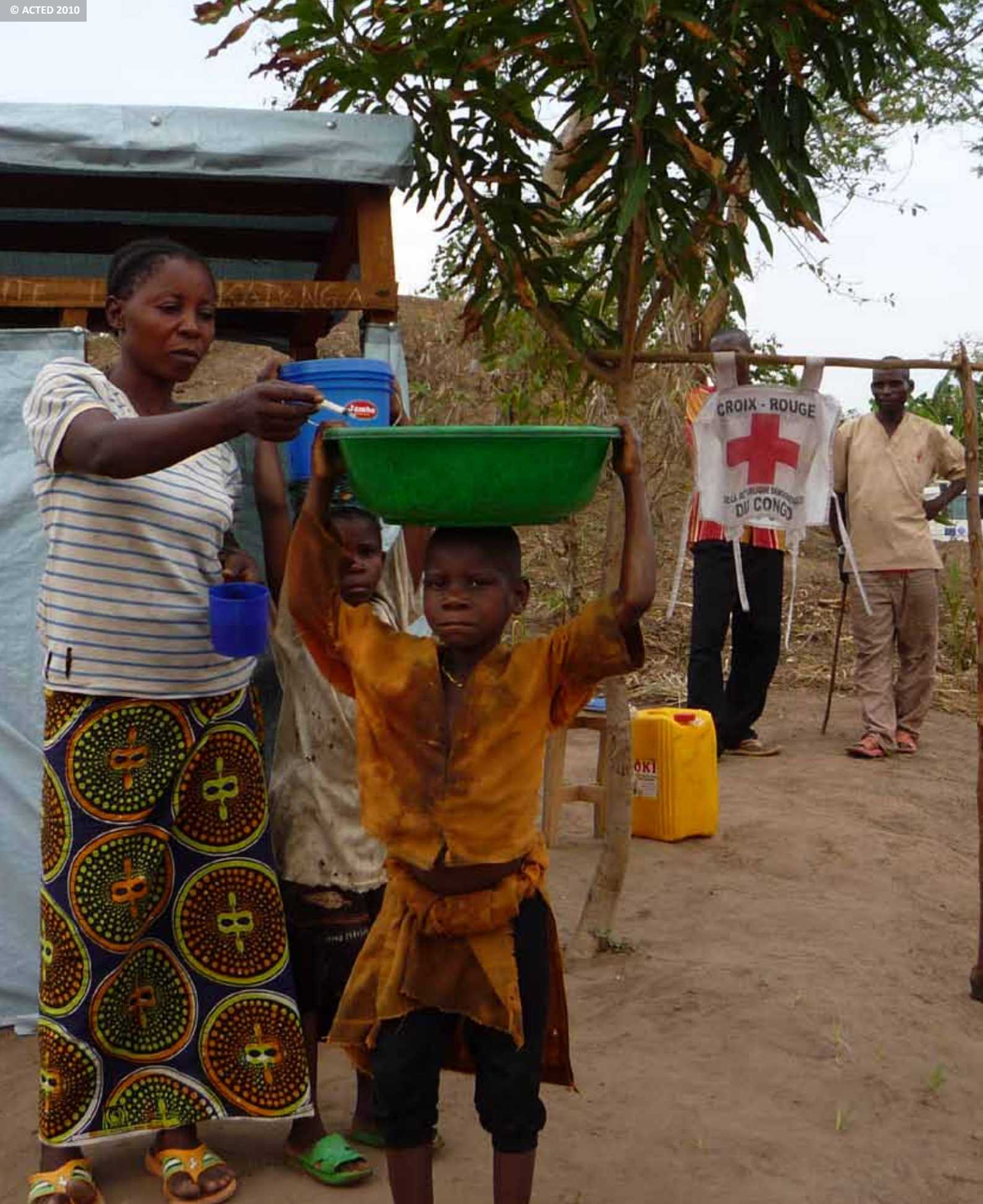
Chlorine production unit run in collaboration with local NGO "Maman Uzima" to fight cholera. Unité de production de chlore en partenariat avec l'ONG locale « Maman Uzima » dans le cadre de la lutte contre le choléra.