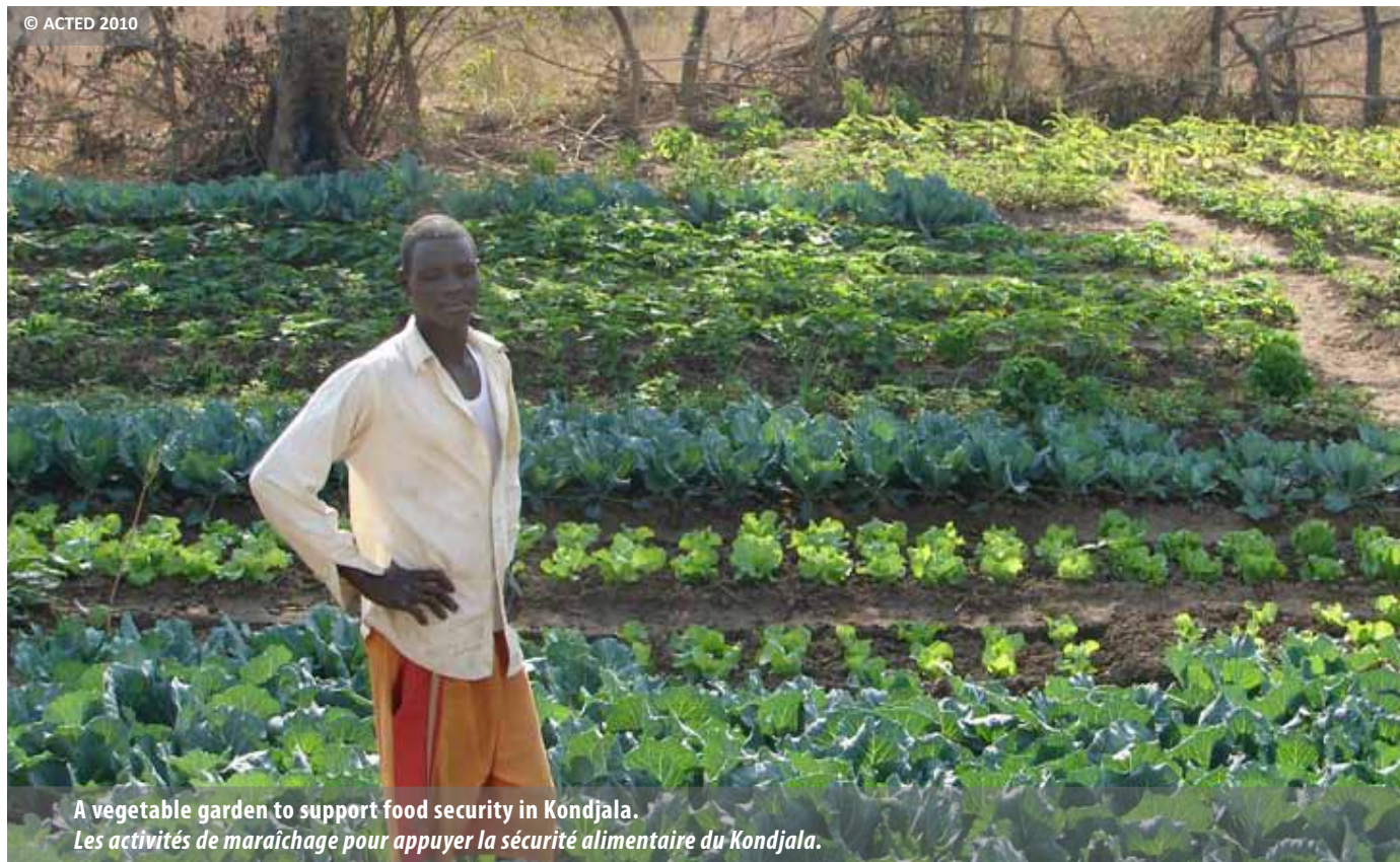
A vegetable garden to support food security in Kondjala. Les activités de maraîchage pour appuyer la sécurité alimentaire du Kondjala.