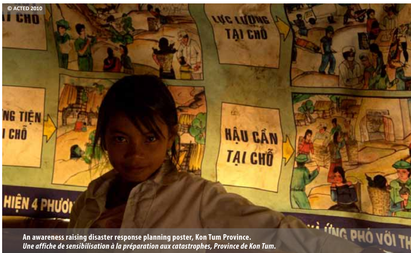
An awareness raising disaster response planning poster, Kon Tum Province. Une affiche de sensibilisation à la préparation aux catastrophes, Province de Kon Tum.

de la réduction des risques de catastrophe pour les communautés vulnérables et isolées. En 2011, ACTED continuera ce travail dans ces régions pour accroître la capacité de résistance des populations sur la base de ce qui a été réalisé en 2010, tout en explorant l'opportunité de soutenir d'autres communautés rurales dans le domaine des moyens de subsistance et de la réduction des risques.